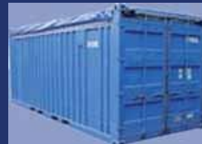
Reefer Acero Aluminio