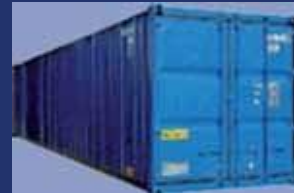
Dry Acero Aluminio

La liquidación de las tasas/uso será efectuada directamente por Ocean Trans.