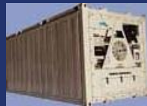
Open-tops Acero Aluminio Open-side / tops / Acero